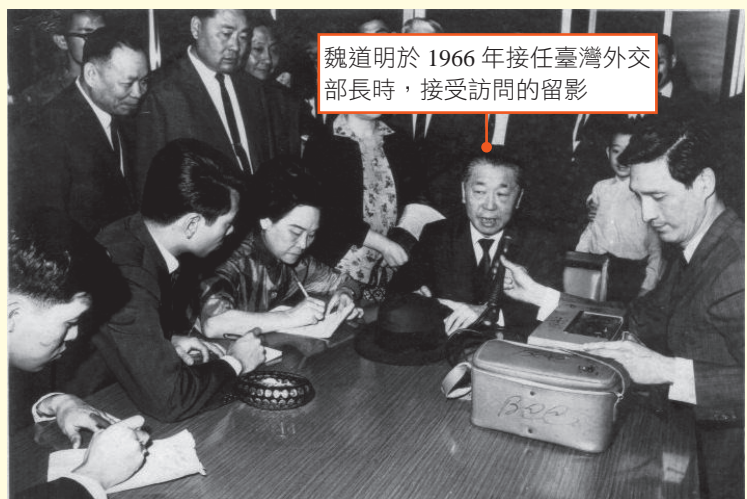
▲ 圖 1-3 第一任臺灣省主席魏道明