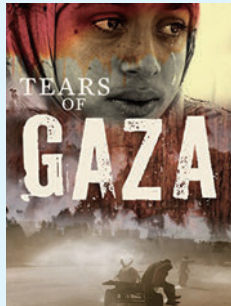
▲ 圖 3-1 《加薩的眼淚》（ Tears of Gaza ）電影海報

影片一開始，即呈現以巴加薩戰爭（爆發於 2008 年 12 月 27 日）的殘酷：僅 22 天，加薩走廊超過 2 萬棟建築、房舍、工廠與農田被摧毀，1,387 人死亡，多數為女人與孩童。另有 5,500 人受傷，其中，7 百多位女性與 1 千 8 百位兒童需要長期治療。