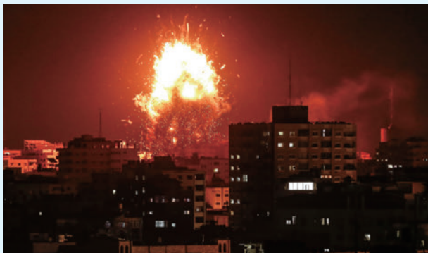
▲ 圖 3-2 以色列空襲加薩走廊，炸毀哈瑪斯阿克薩（Al-Aqsa）電視臺

在戰爭過後，年幼無知的孩童，與父母永別，只能天真地親吻著父親的遺照，久久不願分開。