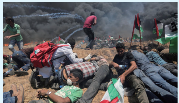
▲ 圖 3-3 巴勒斯坦群眾在加薩邊境抗議，以色列軍隊發射子彈與催淚瓦斯驅趕