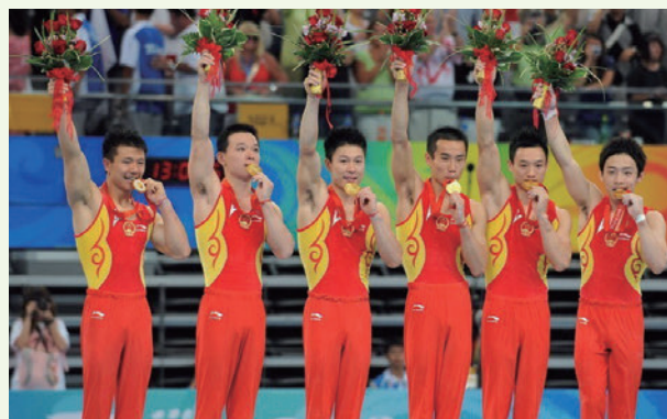
▲ 圖 2-3 2008 年北京奧運，中國奪得男子體操團體賽金牌