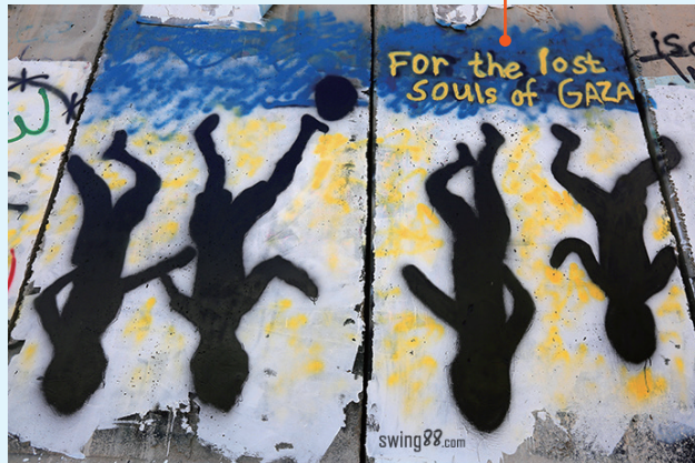
▲ 圖 3-4 以巴邊境的隔離牆上繪滿了塗鴉，反映出巴勒斯坦人對和平的渴望