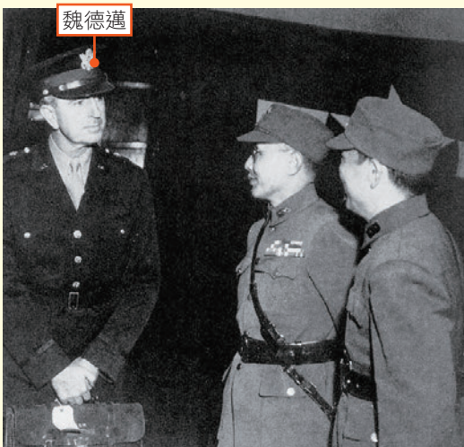
▲ 圖 1-2 魏德邁曾於 1944 年～ 1946 年擔任盟軍中國戰區參謀長，及駐中國美軍指揮官；1947 年又率領考察團來到中國

解析 1947年二二八事件發生後，國民黨政府廢除行政長官公署，並由親美的魏道明擔任省主席，想要消除美國的疑慮，但臺灣人已對國民黨的統治失去信心，故透露想要由美國或聯合國託管的想法。