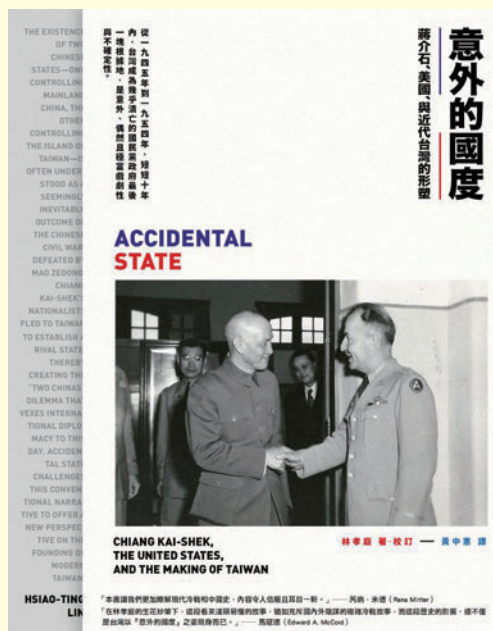
◀ 圖 1-1 《意外的國度：蔣介石、美國、與近代臺灣的形塑》書影

某些現在看來是偶然發生的歷史事件，背後也可能是必然因素造成的。例如：駐臺的美國官員葛超智曾在二二八事件發生後，力主臺灣自決與被託管，他的備忘錄成為美國致蔣介石的二二八事件處理建議書中的一部分，間接影響了蔣在日後的對臺政策，也奠定了中華民國治理臺灣的基礎。葛超智主張「臺灣託管論」、「臺灣自決論」，是基於美國在華利益及與中共之間的戰略考量，對日後的美國對華政策產生極大的影響。