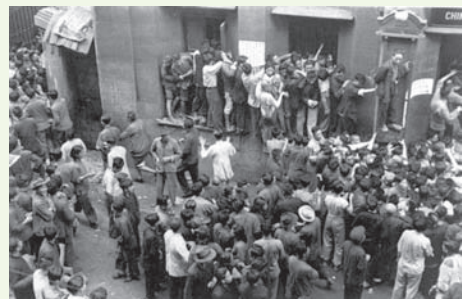
▲圖 2-2 1949年中共進攻上海前夕，民眾爭相湧入上海火車站售票處情景