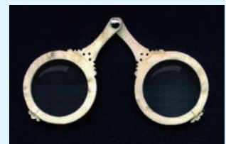
▲圖 3-2 13世紀發明的眼鏡，形狀如兩個小放大鏡，手柄以鉚銜接，形成倒V形可架在鼻梁上