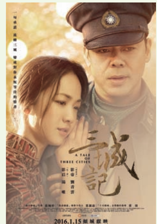
▲圖 2-1 《三城記》電影宣傳海報