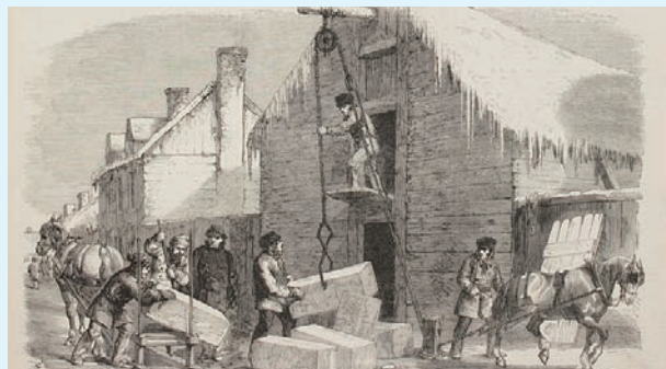
▲ 圖 3-3 加拿大蒙特婁 (Montreal) 製冰 (左)、儲冰 (右) 的情景 (1859 年 4 月 16 日《倫敦新聞畫報》 Illustrated London News , p381)