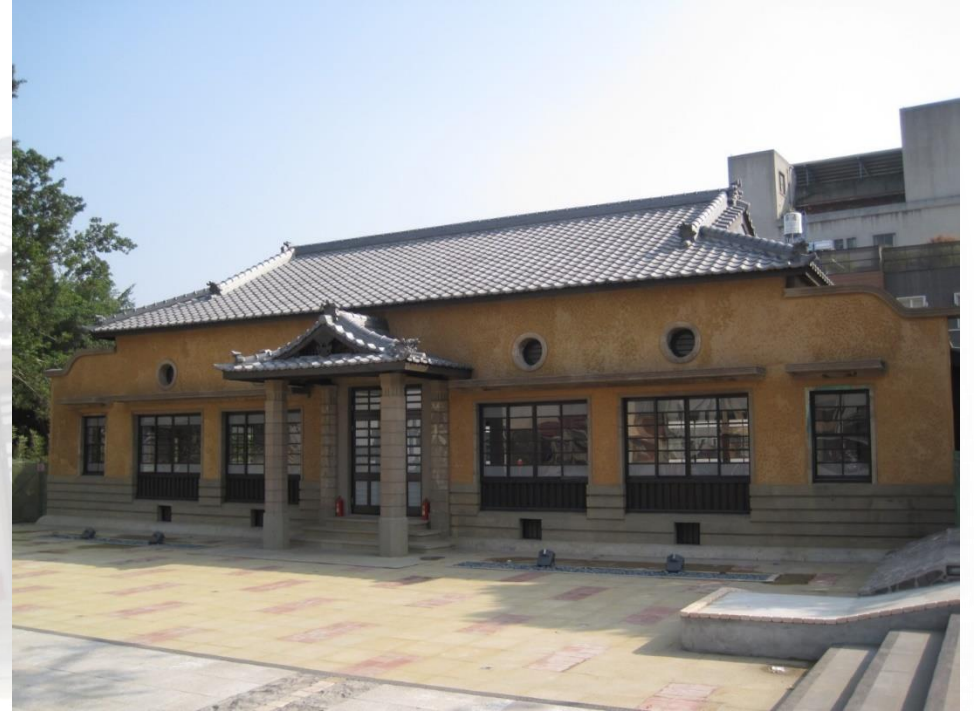
今天新化武德殿，即是當時的新化瘧疾防治所