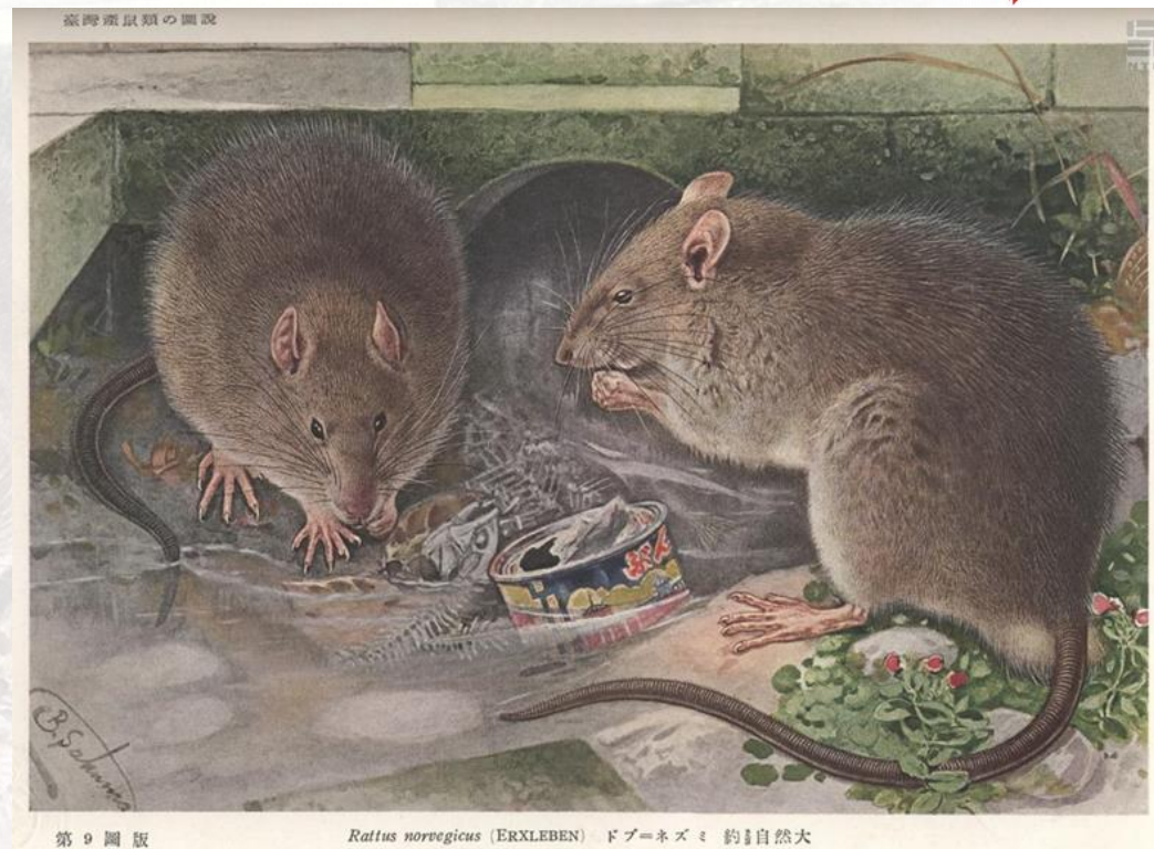
第9圖版 (TM_04_03_0001)